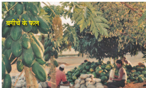
बगीचे के फल

लिए सरकारी टैंकरों द्वारा पानी दिया जाता था। गाँव में रोज़गार नहीं मिलने से गाँव से 6 कि.मी. दूर मज़दूरी करने वाले गाँव ने ज्ञानेश्वरी की इस एक गाथा का अनुसरण किया, और गाँव के नाक-नक्श बदल गए। जिस गाँव में सिर्फ 300 लीटर दूध नहीं हुआ करता वहाँ से हर दिन 6000 लीटर दूध बाहर भेजा जाने लगा। केवल दूध के ज़रिए रोज़ाना दो लाख रुपयों की आमदनी गाँव में आने लगी। 100/125 ट्रक भर कर प्याज़, सब्ज़ियाँ, फल आदि भेजे जाने लगे। गाँव का अर्थकारण बदल गया। रोज़गारी हेतु 6 कि.मी. दूर जिन्हें जाना पड़ता था, उस गाँव में आज काम के लिए पाँच मज़दूर नहीं मिल पाते। प्राकृतिक संसाधनों का शोषण न करते हुए प्रकृति के वरदान का समुचित लाभ उठाया। ज्ञानेश्वरी की गाथा का अनुसरण करने - जलाशय बनाने हेतु बस बारिश के पानी की रोकथाम की, पानी को ज़मीन में रिसाया। भूजल का स्तर ऊपर उठाया। जिस गाँव में 300