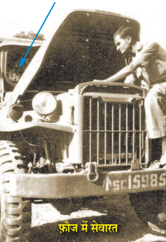
फ़ौज में सेवारत