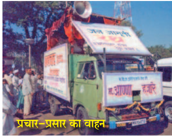
प्रचार-प्रसार का वाहन