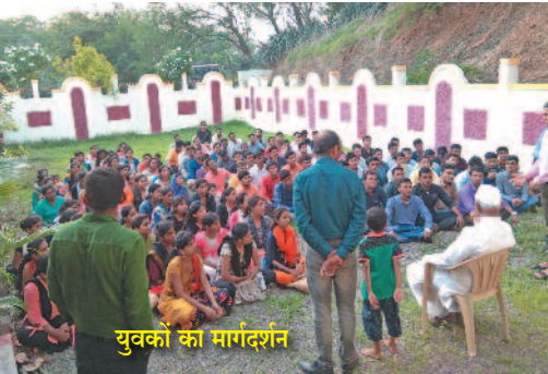
युवकों का मार्गदर्शन

नया दाखिल हुआ था। गाँव वाले क्यों कर मेरी बात मानेंगे? एक दिन मैंने झाड़ू-बकेट उठाई और मैला उठाने लगा। यह काम मैं रोज़ाना करता रहा। धीरे धीरे लोगों पर असर होने लगा। करीब 10/12 महीने लगे इसे बन्द करवाने में। अब सभी मिल कर सफ़ाई का ध्यान रखते हैं। यानि जब उक्ति को कृति का साथ मिला तो उसका असर हुआ और गाँव साफ़-स्वच्छ हुआ। जीवन का लक्ष्य निर्धारित कर अपनी बात को कृति से जोड़ दिया जो बहुत असर कारक रहा। अथक प्रयास किए। इतने परिश्रम किये कि मौत का भी डर न रहा। इस कारण मेरी बात को लोग मानने लगे। मेरे गाँव ने हर दम मुझे अपने परिवार का सदस्य माना, पर मैंने किसी के घर में जाने-आने का सिलसिला नहीं रखा। अगर रखता तो कोई परिवार मेरे नज़दीकी माने जाते। इस तरह का भेदभाव गाँव की एकता बनाये रखने