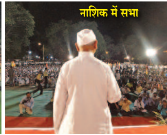
नाशिक में सभा