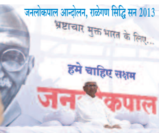
जनलोकपाल आन्दोलन, राष्ट्रगण सिद्धि सन 2013