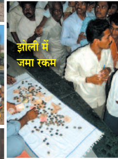
झोली में जमा रकम