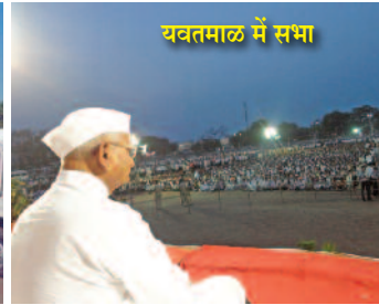
यवतमाल में सभा