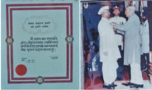
6 अप्रैल 1992 महामहिम राष्ट्रपति जी से 'पद्मभूषण' सम्मान

नष्ट हो जाने पर दुख होता है। मुझे राष्ट्रपति जी द्वारा 'पद्म' पुरस्कार मिले। अपने राज्य में, देश में और विदेशों में कई पुरस्कार मिले जिनसे प्राप्त राशि करोड़ों में है। पर मैंने वह रकम अपने पास रखी ही नहीं। गाँव में करोड़ों रुपयों की लागत के विकास कार्य हुए पर उनमें से 5 रुपए तक पाने की इच्छा कभी नहीं हुई।