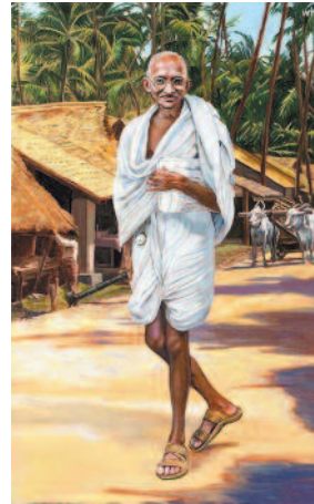
‘देहात में चलो’ महात्मा गांधी

सन 1962 में जब मैं मुम्बई में रहता था, चीन ने भारत पर अचानक हमला किया। हमारे देश की विदेश नीति सब के साथ मैत्री की थी। हम भौचक्रे से रह गए। किसी दुश्मन के साथ लडने के लिए हम किसी भी तरह तैयार न थे। अचानक चीन का आक्रमण होने के कारण हमारी सेना की बडी मात्रा में जीवित हानि हुई, और देश की सम्पत्ति का भी भारी नुकसान हुआ। इन स्थितियों में सरकार ने युवाओं को आह्वान किया कि सीमा सुरक्षा हेतु स्थल सेना, जल सेना और वायु सेना में दाखिल हों। मेरी माता ने राष्ट्र प्रेम के संस्कार मुझपर किये ही थे। सन 1963 में मैं फ़ौज में भर्ती हुआ। सेना में भर्ती होने के बाद मन में बार बार एक सवाल उठता रहा कि भगवान ने दुनिया की ये क्या सूत बना रखी है कि हर कोई खाली हाथ जनमता है और मरते दम भी खाली हाथ ही जाता है। फिर भी ज़िन्दगी भर “मैं- मेरा...” करते करते दौड-भाग में लगा रहता है। किस लिए जीता है, जब कि हाथ में कुछ भी नहीं आता? सिकन्दर महान ने पूरी दुनिया पर राज किया, पर एक दिन वो भी खाली हाथ गया। और जाते समय सबको बताता गया कि भले ही मैंने दुनिया पर राज किया हो, जा तो खाली हाथ रहा हूं, कुछ भी