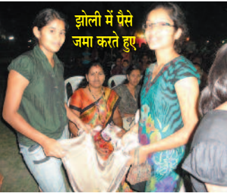
झोली में पैसे जमा करते हुए

महाराष्ट्र राज्य में लोक शिक्षा, लोक जागरण के लिए लगातार 10 वर्ष मैं भ्रमण करता रहा। उसकी बदौलत राज्य के 33 जिलों के 252 तहसीलों में कार्यकर्ता संगठित हुए। संगठन के प्रभाव से सरकार पर दबाव बना और जनता के लिए दस नए कानून बने। इस लिए जो भ्रष्टाचार के खिलाफ काम करना चाहते हैं, उन आन्दोलन कारियों को विशाल संगठन बनाना आवश्यक है। बिना संगठन के जन शक्ति का समर्थन नहीं मिलेगा। संगठन बढेगा तभी शासन पर दबाव ला सकेंगे। शासन पर दबाव बनाना हर किसी का फ़र्ज बनता है। इस हेतु लोक शिक्षा, लोक जागरण यात्राएं अनिवार्य हैं। शासकीय कोषागार में