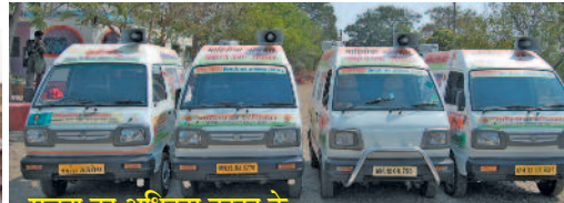
सूचना का अधिकार कानून के प्रचार-प्रसार हेतु वैन