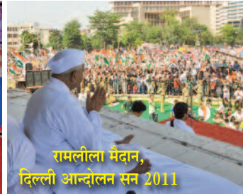
रामलीला मैदान, दिल्ली आन्दोलन सन 2011