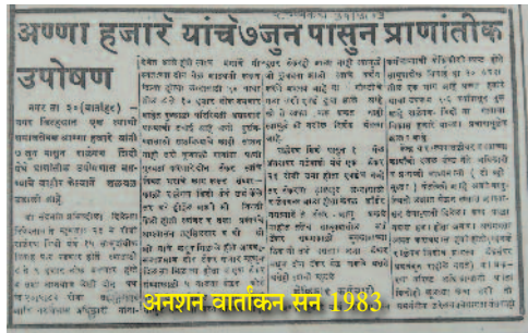
अनशन वाताकन सन 1973

के कारण बड़े पैमाने पर रिसता जा रहा है। जिन गरीबों के लिए उसका प्रयोजन है उनके बजाय किसी बिचौलिये का धन बन रहा है। नतीजा यही निकलता है कि इस चोरी की क्रीमत वसूलने के लिए घटिया स्तर का काम किया जाता है। अगर इस रिसाव को नहीं रोका गया तो विकास की निर्धारित लक्ष्य प्राप्ति नहीं होगी। सन 1975 में गाँव में विकास कार्य का श्रीगणेश किया और सन 1990 में भ्रष्टाचार के खिलाफ लड़ने की शुरुआत की। जिन जिन सरकारी महकमों में भ्रष्टाचार दिखाई दिया, वहाँ सबूत इकट्ठा कर उनके आधार पर जाँच की माँग की, यदि माँग को मंजूर नहीं किया गया तो धरना, मोर्चा, मौन आन्दोलन, अनशन इन अहिंसक तरीकों से आन्दोलन चलाए। पूरे महाराष्ट्र राज्य में ये आन्दोलन एक ही समय पर होने लगे। सरकार पर दबाव बढ़ने लगा। सर्वदूर पनपते भ्रष्टाचार के कारण महँगाई बढ़ने लगी। महँगाई की आग में गरीब लोग झुलसने लगे। यूँ तो सरकारी दफ्तर में काम करवाना जनता का हक था लेकिन बिना घूस दिए किसीका काम नहीं हो पाता था। जनता त्रस्त हो उठी। भ्रष्टाचार विरोधी जन आन्दोलन जनता के मन की बात बोलता था। इस आन्दोलन को जनता का अच्छा समर्थन मिलने लगा। सन 1997 में 'भ्रष्टाचार विरोधी जन आन्दोलन न्यास' के नाम से धर्मादाय आयुक्त से विधिवत् पंजीकृत न्यास की स्थापना