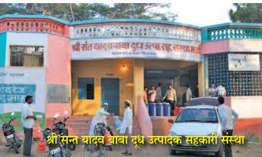
श्री सन्त यादव बाबा दूध उत्पादक सहकारी संस्था