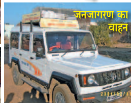
जनजागरण का वाहन