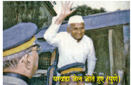
यरवडा जेल जाते हुए (पुणे)

चातुर्मास का एक और भी लाभ हुआ। सन्त वाणी के श्रवण से धन, दौलत, माया, मोह के प्रति मन की तनिक भी आसक्ति नहीं रही। बस गाँव, समाज, देश की सेवा निष्काम भाव से करते रहना यही भाव पक्का हुआ। सफलता मिले या न भी मिले। विचारों में दृढ़ता आ गई। पता चला कि त्याग में शान्ति है और भोग में रोग है। उसका अनुभव भी होता रहा। निष्काम कर्म करते जाना। न किसीसे कुछ माँगना है, न किसीसे कुछ लेना। निरन्तर कर्म निष्काम भाव से करते जाना। जीवन यापन के लिए मिलने वाली पेंशन पर्याप्त थी। किसी पर बोझ बनने की नौबत नहीं आई। यही कारण था कि बड़ी बड़ी परियोजनाओं के निर्माण कार्य करते समय फूटी कौड़ी की भी अपेक्षा नहीं थी। सार्वजनीन जीवन में पारदर्शिता लाने हेतु मेरा अपना बैंक पासबुक भी कभी अपने पास नहीं रखा। कोई भी उसे देख पाए इतनी पारदर्शिता रखी। मेरे बैंक खाते का हिसाब-किताब सब के लिए खुला रखा। पारदर्शिता का सार्वजनीन जीवन में बड़ा मोल है। शको-शुबहा की गुंजाइश ही न रहे। मैं ईश्वर में आस्था रखता हूँ। जिन्दगी भर ईश्वर से यही वर माँगता रहा कि मुझे किसी का दुख न देखना पड़े। बस और कुछ नहीं माँगता मैं भगवान से। विरोध, निन्दा, अपमान का कई बार सामना किया मगर दिल को हारने नहीं दिया। मैं राजनेताओं के भ्रष्टाचार को उजागर करता हूँ इस लिए बदले की भावना से मुझे जेल भी भिजवाया गया। फिर भी निराशा नहीं छाई। मैं जान चुका था कि फलदार पेड़ ही पत्थरों का निशाना बनते हैं। जो फल नहीं देते उनको पत्थर नहीं झेलने पड़ते। आम के पेड़ पे पत्थर पड़ते हैं, बभूल पर नहीं। सन्तों ने कहा है “निन्दक नियरै राखिये।” निष्काम कर्म ही ईश्वर की पूजा है इस भाव से कर्म करता रहा। जब तक शरीर में प्राण