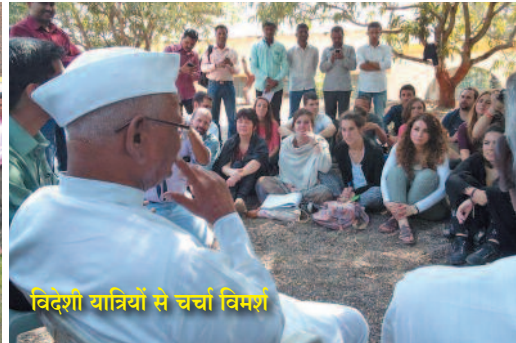
विदेशी यात्रियों से चर्चा विमर्श

में बाधक होता है। गाँव की हर व्यक्ति की नज़र मुझ पर रहती है। मेरा खान-पान क्या है, कहाँ रहता हूँ, मेरा रहन-सहन, मेरा चाल-चलन, मेरी बातचीत -हर बात पर ग़ौर किया जाता है। बिना शादी के जीवन बसर करना आसान नहीं है। और लोग मुझ पर नज़र रखते हैं। इन्सान का मन बड़ा ही चंचल है। चंचल क्या, तेज़ है, धोखेबाज भी है। पता नहीं कब धोखा दे दे। मगर ईश्वर की मुझपर महती कृपा रही है। 82 वर्ष के जीवन काल में इस मन