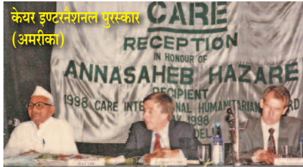
केयर इण्टरनेशनल पुरस्कार (अमरीका)

अमरीका, साऊथ कोरिया, कैनडा आदि देशों से प्राप्त पुरस्कारों की राशि अगर मैं मेरे पास रखता तो हो सकता है मुझे भी रात सोते समय नीन्द की गोलियाँ खानी पडती। आज बिस्तर पर लेटते ही कब नीन्द लग जाती है, पता ही नहीं चलता। पुरस्कार में प्राप्त करोड़ों रुपयों की राशि को 'स्वामी विवेकानन्द कृतज्ञता निधि' इस न्यास का निर्माण कर जन सेवा