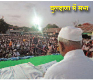
बुलढाणा में सभा