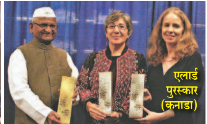
एलार्ड पुरस्कार (केनाडा)