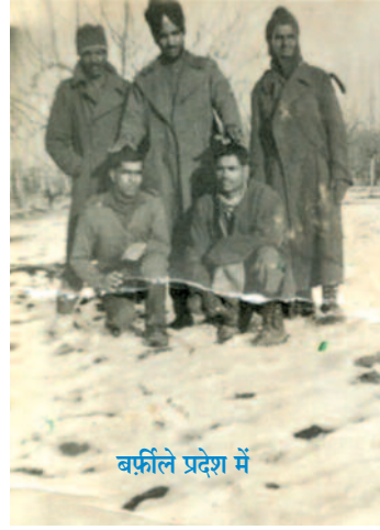
बर्फ़ीले प्रदेश में

कैसी सेवा कर पाऊंगा? कुछ प्रबन्ध तो होना चाहिये जीते रहने के लिए। सेना में मात्र दो वर्ष की सेवा हो पाई थी। इन स्थितियों में गाँव, समाज, देश की सेवा के लिए फ़ौज की नौकरी को छोड़ देना मुश्किल लग रहा था। सोच-विचार कर तय किया कि सेना में कम से कम 15 साल सेवा दें, तब जा के पेन्शन मिल पाएगी। फिर किसी पर बोझ बने रहने की नौबत नहीं आएगी। साथ ही यह भी तय कर लिया कि शादी नहीं करूंगा। शादी कर बैठता तो घर-गृहस्थी के कामों में ही उलझ जाता। फिर कहाँ की सेवा? इस अन्देशे से अविवाहित रहने की बात मैंने ठान ली। जब तक जीऊँ मैं गाँव, समाज, देश के लिए ही जीऊँगा और मरना भी तो गाँव, समाज, देश की सेवा करते हुए ही मरूँगा। यह मेरा फ़ैसला पाकिस्तान की सीमा पर खेमकरण क्षेत्र में मेरी उम्र के 25 वें वर्ष में हुआ और आज उम्र के 82 वें वर्ष में भी मैं इस फ़ैसले पर अडिग हूँ। यह ईश्वर की मुझ पर महती कृपा है ऐसा मैं मानता हूँ। बिना शादी किए समाज में काम करते रहना आसान नहीं है, लेकिन ईश्वर की कृपा से 82 साल की जीवनी मैं इस तरह बिता पाया कि चरित्र पर कलंक का एक धब्बा भी नहीं लगने दिया। इस लिए मन को क़ाबू में रखने की ताक़त ईश्वर से मिलती रही।