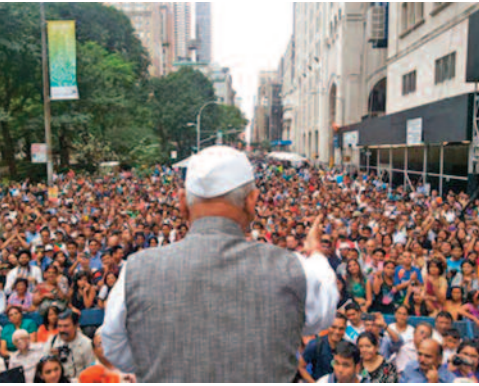
अमरीका में भीड़ को सम्बोधन

जनता और कार्यकर्ता संविधान और कानूनों को समझने की कोशिश नहीं करते। फिर मैंने महाराष्ट्र राज्य तथा देश भर में विभिन्न स्थानों पर विभिन्न विषयों पर लोक शिक्षा और लोक जागरण हेतु कई सभाएं कीं।