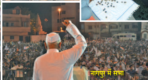
नागपुर में सभा