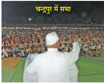
चन्द्रपुर में सभा