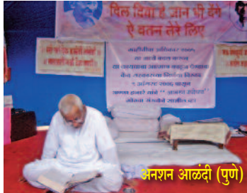
अनशन आळंदी (पुणे)