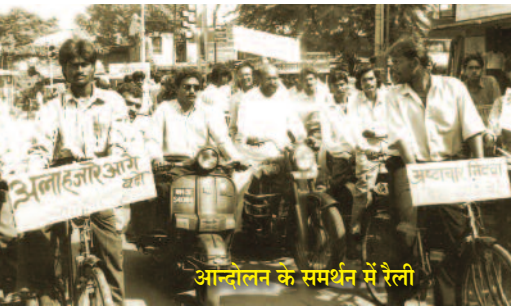
आन्दोलन के समर्थन में रैली

समाज के लिए आवश्यक विकास कार्यों को गतिमान् करना और उन विकास कार्यों में लगे भ्रष्टाचार के छेदों को मिटाना ये एक ही सिक्के के दो पहलू हैं। विकास कार्यों का काम करते करते यह बात समझ आई कि विकास काम के लिए प्रस्तावित निधि भ्रष्टाचार