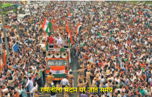
रामलीला मैदान पर जाते समय

रालेगणसिद्धि परिवार और भ्रष्टाचार विरोधी जन आंदोलन न्यास ने बढ़ते हुए भ्रष्टाचार को रोकने के लिए राज्य और देश में अहिंसा का रास्ता अपनाते हुए धरने, मोर्चे, मौन अनशन करते हुए सरकार को राज्य और देश के लिए 10 कानून बनाने के लिए मजबूर किया। इसके कारण राज्य और देश का भ्रष्टाचार काफी हद तक कम हुआ है।