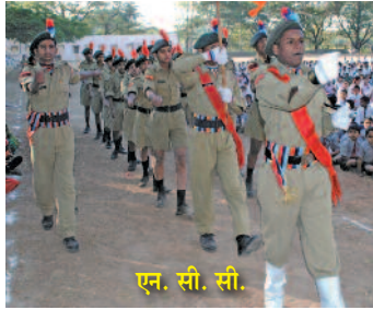
एन. सी. सी.