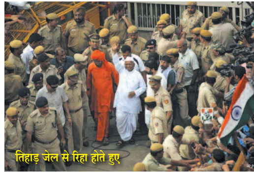
तिहाड़ जेल से रिहा होते हुए

लेकिन सत्य कभी पराजित नहीं होता। अगर युवा ठान लें तो देश का उज्ज्वल भविष्य दूर नहीं है। प्रकृति का नियम है कि ज्वार, बाजरा, मक्का जैसी फसल में दानों से भरे हुए भुट्टे प्राप्त करने के लिए पहले एक दाना जमीन में बोना पड़ता है। एक दाना जमीन में नहीं गया तो दानों से भरे हुए भुट्टे कैसे मिलेंगे? जो दाने जमीन में नहीं जाते वे दाने आटे की चक्की