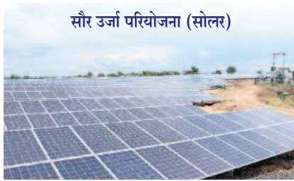
सौर उर्जा परियोजना (सोलर)

ईश्वर ने हमें सूर्य की रोशनी और हवा के रूप में नियामत दी है इसीलिए रालेगणसिद्धि में छात्रावास, हिंद स्वराज ट्रस्ट, रसोईघर और बाथरूम के लिए सोलर सिस्टम लगाया गया है। अब 2 मेगावैट प्रोजेक्ट बनाकर 5 से बोर्ड की तरफ से जाती है। आज के उपयोग एक स्वराज ट्रस्ट के नए कमरों में बिजली बोर्ड की जो बिजली इस्तेमाल की जाती थी उसका बिल आठ हजार रुपए महीना आता था। अब 15 किलोवैट सोलर पर बिजली निर्माण होने से हर साल बिजली के बिल के सालाना 1 लाख रुपए बचते हैं। इसके लिए एक ही बार खर्च करना पड़ता है। प्रदूषण भी नहीं होता। बिजली निर्माण में कोयला जलाया जाता है। उस से प्रदूषण जादा बढ़ता है। रालेगण सिद्धि में अलग अलग जगह पर सोलर प्लांट लग गए हैं।