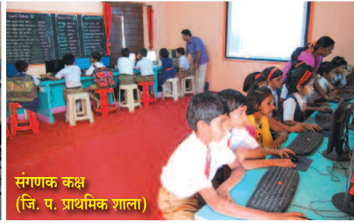
संगणक कक्ष (जि. प. प्राथमिक शाला)