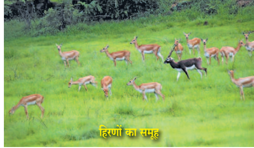
हिरणों का समूह

इसका मतलब यह नहीं है कि हर कोई भी युवक अन्ना हजारे जैसा विवाह ना करे और मंदिर में रहे। ऐसा जीवन बिताना आसान नहीं है। बहुत ही कठिन है। लेकिन असंभव नहीं है। हर कार्यकर्ता ने विवाह करें, गृहस्थी बसाएं लेकिन छोटा परिवार ना करते हुए बड़ा परिवार करें। छोटे परिवार में दुःख होते हैं। जितना परिवार बड़ा होगा उतना जीवन में आनंद होता है। यह फर्क है। अन्ना हजारे ने विवाह नहीं किया लेकिन परिवार नहीं छूटा। छोटा परिवार के बजाय बड़ा परिवार बन गया। पहले गांव परिवार बन गया और अब पुरा देश परिवार बन गया है। बड़े परिवार के कारण जीवन में आनंद है।