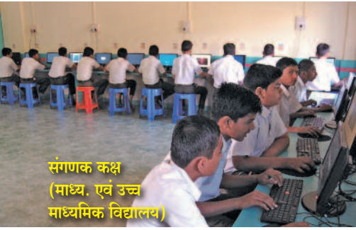
संगणक कक्ष (माध्य. एवं उच्च माध्यमिक विद्यालय)