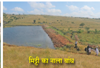
मिट्टी का नाला बांध